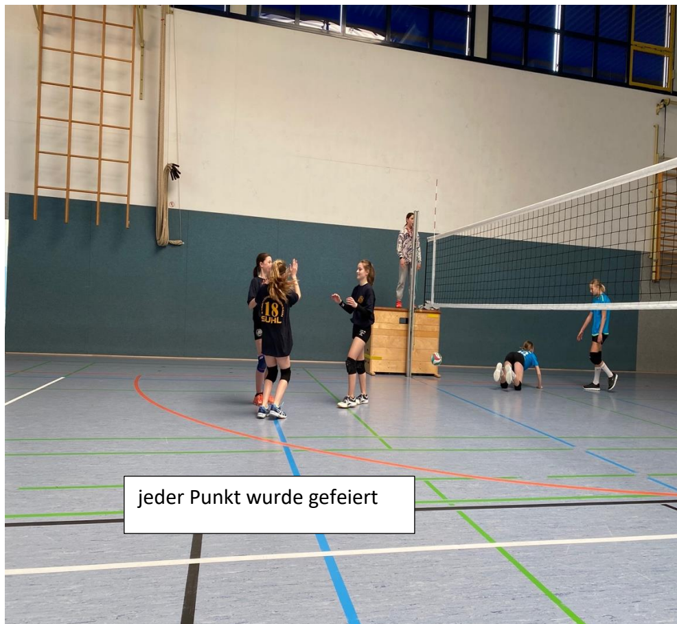
jeder Punkt wurde gefeiert