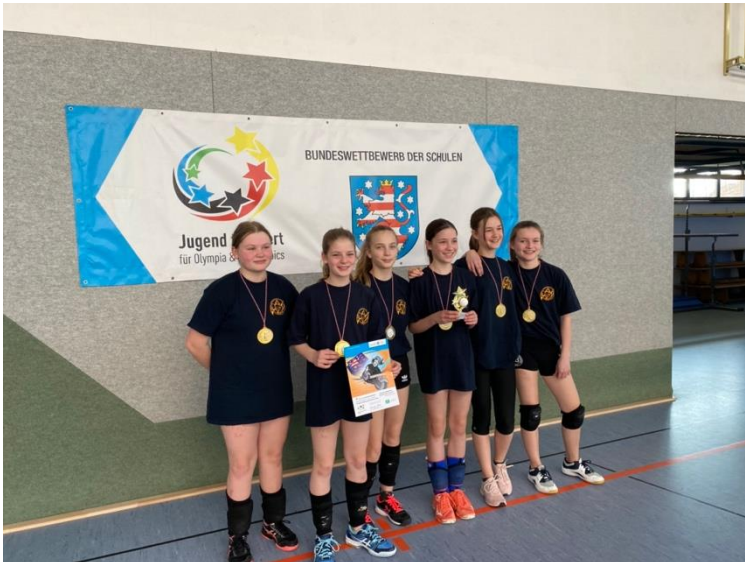
die glücklichen Gewinner