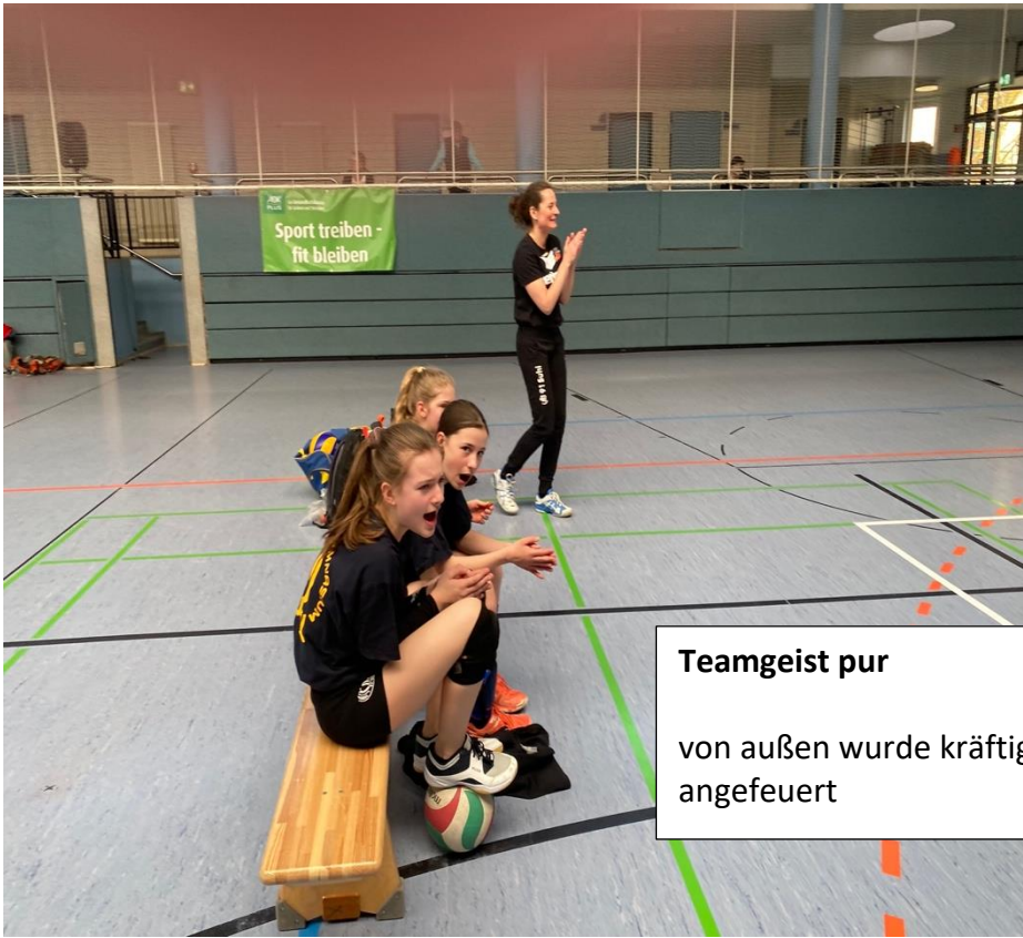
Teamgeist pur von außen wurde kräftig angefeuert